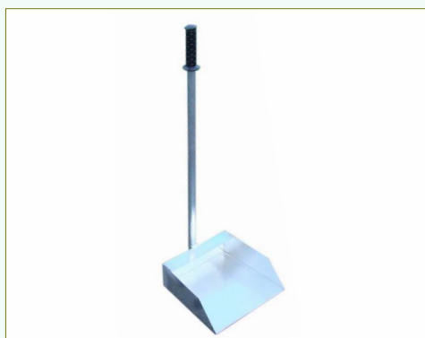
Refª 134/D - Pá em aço galvanizado Comprimento: 85 cm. Peso: 3,5 Kg. Refª 134/F - Pá em alumínio Comprimento: 85 cm. Peso: 1 Kg.