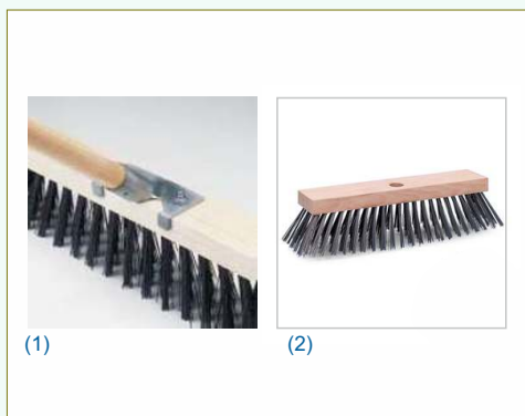
(1) Refª 190 - Escovão em nylon com palheta de 5 cm. Comprimento: 30 cm. Peso: 0,750 Kg. (2) Refª 191 - Escovão com palhetas de aço com 8,5 cm. Comprimento: 40 cm. Peso: 1 Kg. (Refª 190 / 191 - cabo vendido separadamente)