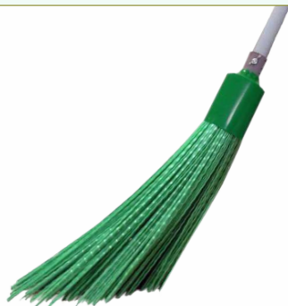
Refª 162/ERRVV - Recarga de vassoura com filamento em polipropileno de 42 cm. Formato REDONDO em «V» e cor verde. Peso: 0,660 Kg. Compatível para cabo 162/F1M e 162/F1A.