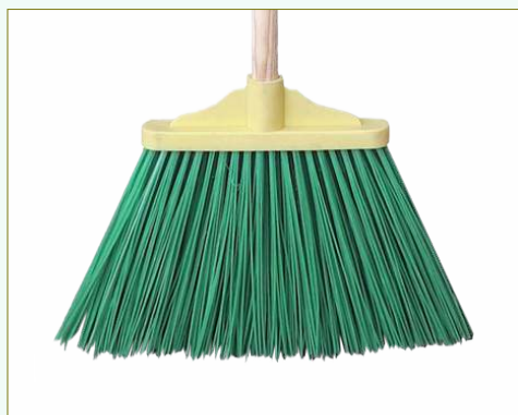
Refª 162/E460 - Recarga de vassoura com filamento em polipropileno de 22 cm. Formato plano e cor verde. Peso: 0,210 Kg. Compatível para cabo 162/F2M e 162/F2A.