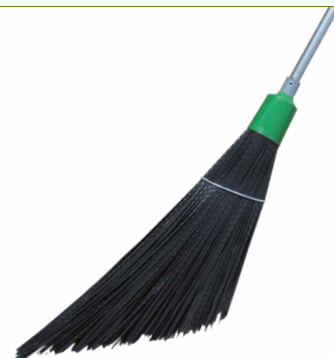
Refª 162/EPRV75 - Recarga de vassoura com filamento em polipropileno de 75 cm. Formato plano em «V» e cor preta. Peso: 0,850 Kg. Compatível para cabo 162/F1M e 162/F1A.