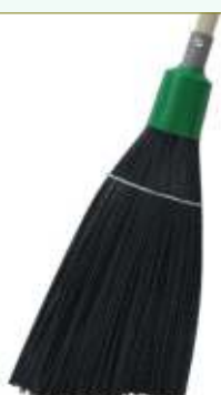
Refª 162/EPR - Recarga de vassoura com filamento em polipropileno de 41 cm. Formato plano/recortado e cor preta. Peso: 0,720 Kg. Compatível para cabo 162/F1M e 162/F1A.