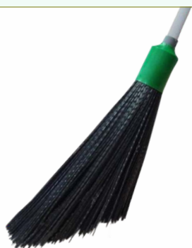
Refª 162/ERRVP - Recarga de vassoura com filamento em polipropileno de 42 cm. Formato redondo em «V» e cor preta. Peso: 0,660 Kg. Compatível para cabo 162/F1M e 162/F1A.