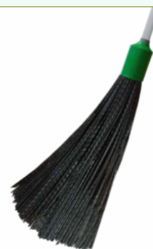
Refª 162/ER - Recarga de vassoura com filamento em polipropileno de 42 cm. Formato redondo e cor preta. Peso: 0,740 Kg. Compatível para cabo 162/F1M e 162/F1A.