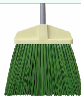
Refª 162/E500 - Recarga de vassoura com filamento em polipropileno de 24 cm. Formato plano e cor verde. Peso: 0,500 Kg. Compatível para cabo 162/F2M e 162/F2A.