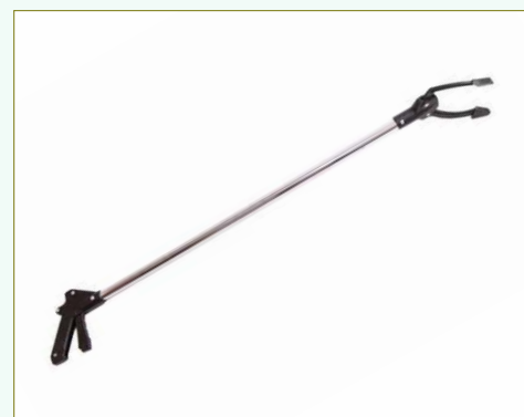
Pinça multiusos em alumínio - Refª 288 Comprimento: 100 cm Peso: 1 Kg