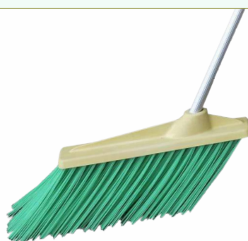
Refª 162/E5460 - Recarga de escovão com filamento em polipropileno de 24,5 cm. Formato plano e cor verde. Peso: 0,930 Kg. Compatível para cabo 162/F3A.