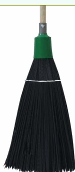
Refª 162/EP - Recarga de vassoura com filamento em polipropileno de 43 cm. Formato plano e cor preta. Peso: 0,800 Kg. Compatível para cabo 162/F1M e 162/F1A.